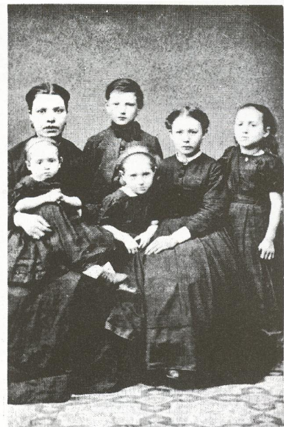
Kjøbmagergade 64, Hjørnet af Kulturvet.

Lokalerne er ikke langt fra at være imponerende, tilsammen findes ikke mindre end 15 værelser, deriblandt de overdådigt udstyrede venteværelser med klaver; et lille bibliotek o.s.v. og det ualmindeligt smukke og smagfulde omklædningsværelse. Selve atelieret er stort og lyst. På væggene hænger de nydeligste kulfotografier, tagen efter Nivaa-samlingens billeder. Hr. Elfelt er den, der har æren af at have indført kulfotografien herhjemme, og de resultater, han har nået i så henseende, er