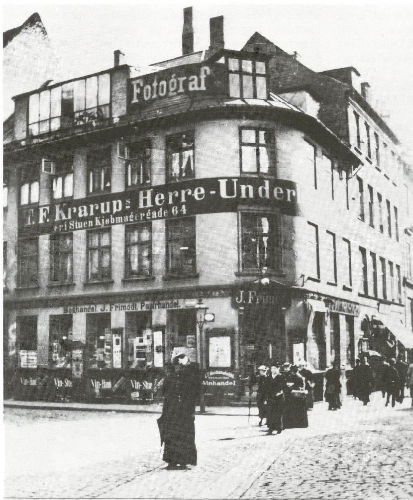
Hjørnet af Kjøbmagergade og Kultorget.

Bedst kendt og be-rømmet blev nok Sophus Juncker-Jen-sens optagelse fra Højbro Plads. Men pyt, lidt konkurrence skærper kun appetit-ten, og da dagens dont var gjort, blev re-ste Fortsettets næste side ►