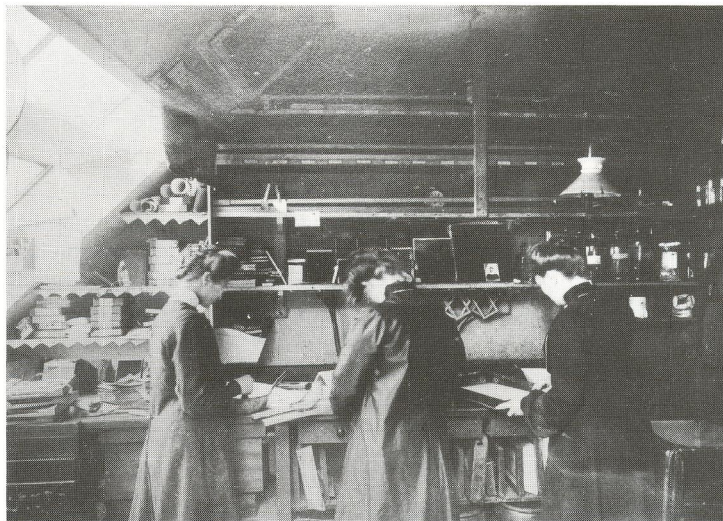
Mørkekammeret på Østergade 24. (Hans Bonnesen)

hans omsætning steget til over 20 kroner pr. dag.